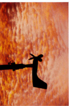
夕焼け空を飛ぶが如く (ペルー沖)