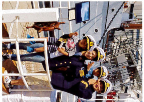
かわいい“船乗り”たちが敬礼！ (昨年の展示会から)