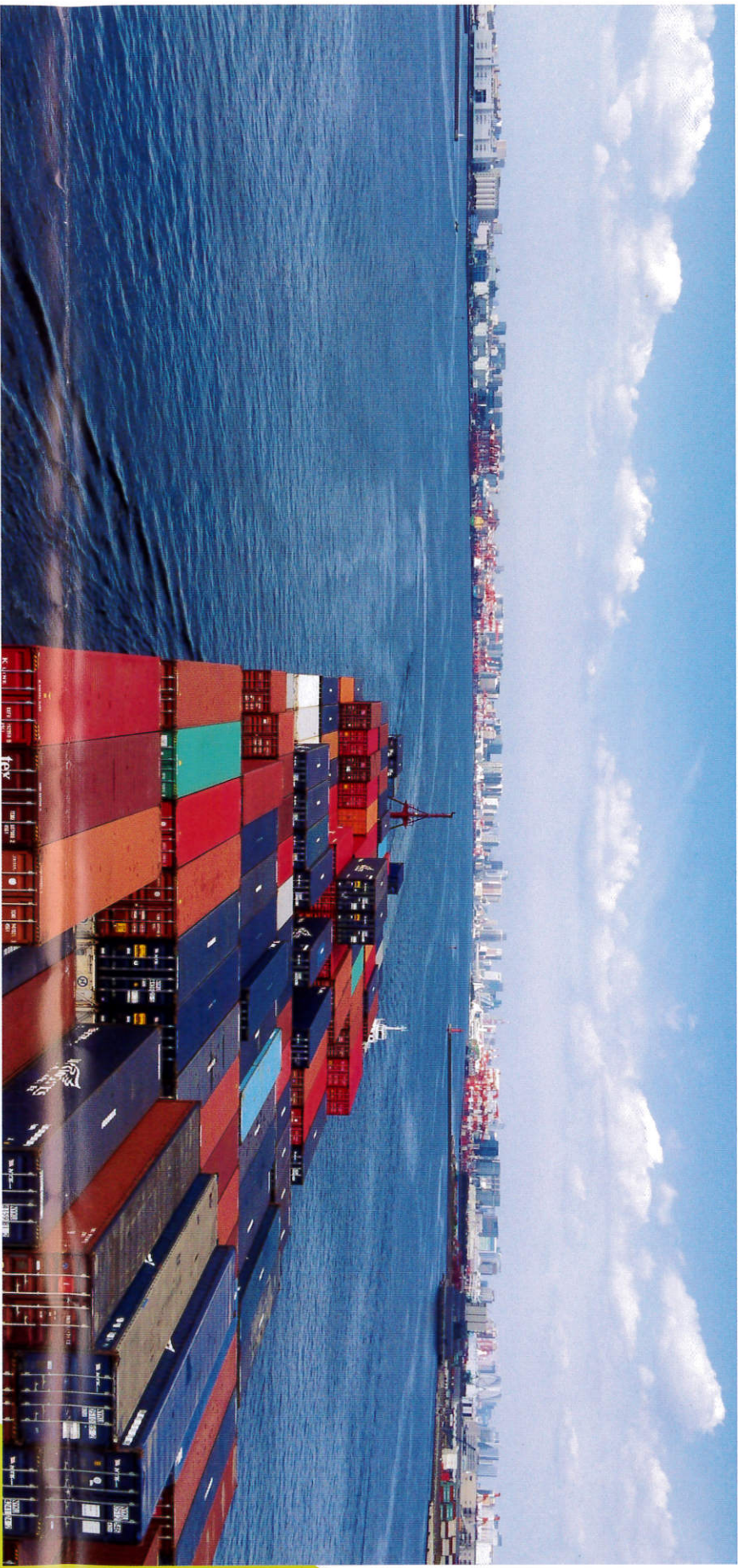
今日も暮らしの中へ (東京港)