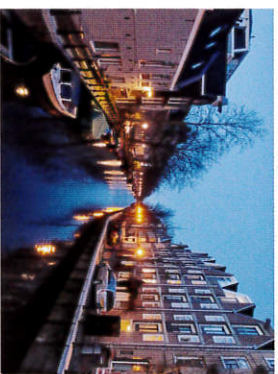
薄暮れの向こうで (アムステルダム)