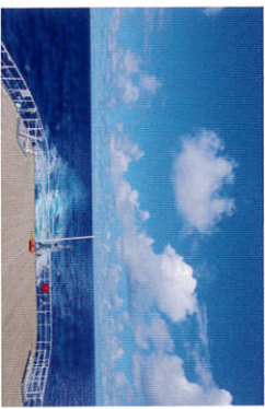
のどかな午後 (太平洋)